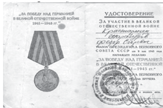
Удостоверение к медали «За победу над Германией в Великой Отечественной войне 1941-1945 гг.»

Меня тронула история прадеда, был восхищён его силой духа, отвагой и патриотизмом. Исследуя семейный архив с документами, я обнаружил в нём удостоверение к медали «За победу над Германией в Великой Отечественной войне 1941-1945 гг.». Сама медаль, к большому сожалению, была безвозвратно утрачена. Кроме того, мой дед был награжден знаком «Отличный минометчик» первого мая 1943 года. Позже был представлен к Правительственной награде - орден Красной Звезды, но данная награда не была вручена по неизвестной нашей семье причине